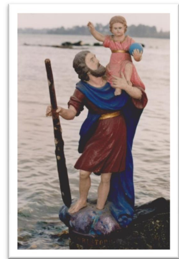
La statue de procession sculptée vers 1800

« Regarde Saint Christophe et va-t'en rassuré » (prière du Moyen Age)