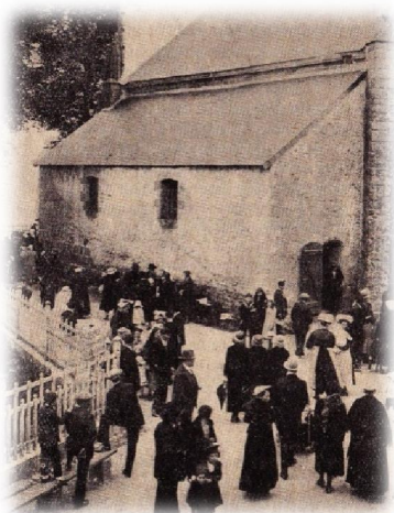
Le Pardon en 1937

Autrefois, le pardon avait lieu les lundis des trois premières semaines de mai. Les fidèles se rendaient à la chapelle pour y prier mais aussi pour demander des forces pour leurs enfants. La journée commençait par la messe (7 heures du matin), suivie de la bénédiction des enfants, des vêpres, du chapelet et s'achevait par la bénédiction du Saint Sacrement et des reliques (à partir de 1846). La tradition veut que l'on fasse également trois fois le tour de la chapelle.